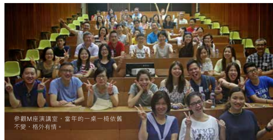
參觀M座演講室，當年的一桌一椅依舊不變，格外有情。

校友點評：「康樂活動中心設備齊全，無論泳池、羽毛球場及乒乓球室均環境舒適，我們十分享受在這兒做運動；瑜珈班導師亦非常專業，我們很滿意這次的行程安排，希望這個活動能每年舉辦，讓更多同學一睹母校的新貌，藉此聯誼一番，凝聚校友力量。」