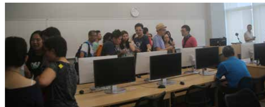
參觀金融交易實驗室

校友點評：「今日的恒管校舍比從前寬敞得多，發展漸見規模。從前學校位置偏僻，附近只有寥寥幾間村屋。現在交通便利，新教學大樓、住宿書院陸續落成，設備今非昔比。我們十分羨慕現在的學生，希望他們能夠善用學校資源，用心讀書。」