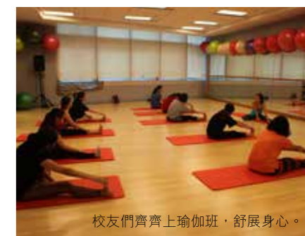
校友們齊齊上瑜珈班，舒展身心。