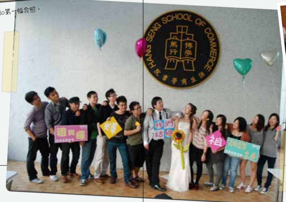
二人與一班好同學回母校拍攝婚照。