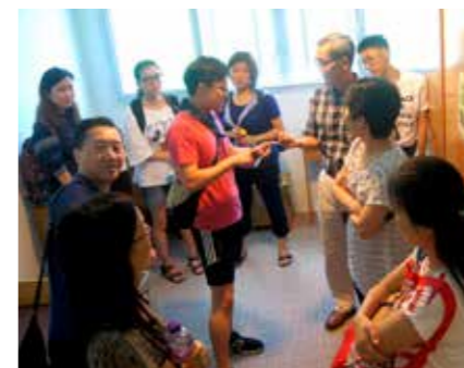
學生大使帶領校友們參觀賽馬會住宿書院。

為了向一眾闊別校園多年的校友介紹母校歷來的發展，我們安排了校園導賞，由學生大使帶領他們遊覽校園設施、參觀校園舊有的課室及演講廳，並前往新建成的何善衡教學大樓、利國偉教學大樓及恒管廣場等參觀，加深他們對恒管新校園的認識。