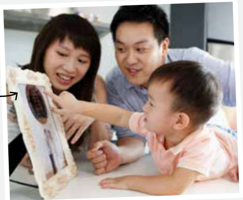
兩口子與兒子一起重溫福照。

夫婦兩雖然工作忙碌，又要照顧兩名年幼兒子，但他們依然積極參與校友事務，擔任校友會秘書一職，彼此有感而發。「在母校認識了一班莫逆之交，更找到了相濡以沫的另一半，母校帶給我們不少美好的回憶，我倆心繫恒商，很希望能夠竭盡綿力，回饋母校。」兩位更藉此機會呼籲更多校友、畢業生加入校友會，凝聚校友力量。