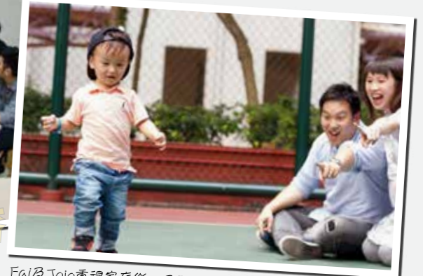
Fai及JoJo重視家庭樂，不願錯過陪伴兒子成長的機會。